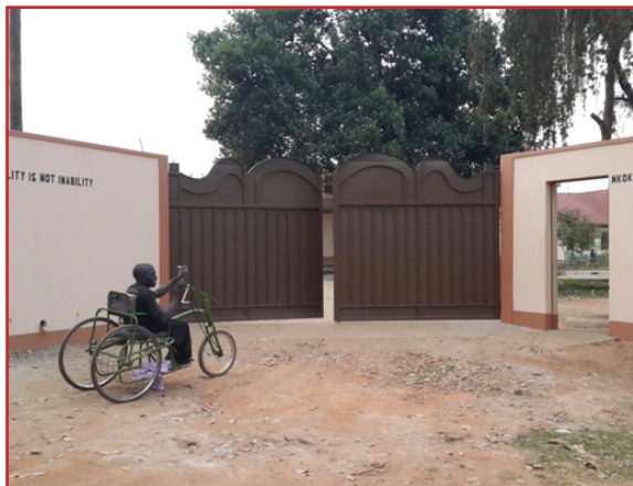
Opravená brána do projektu, Providence Home, Uganda