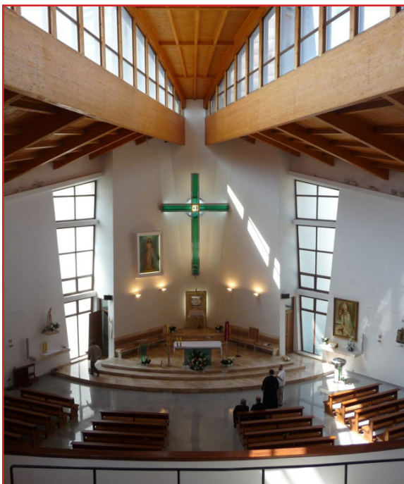
Interiér Svätyne Božieho milosrdenstva v Smižanoch