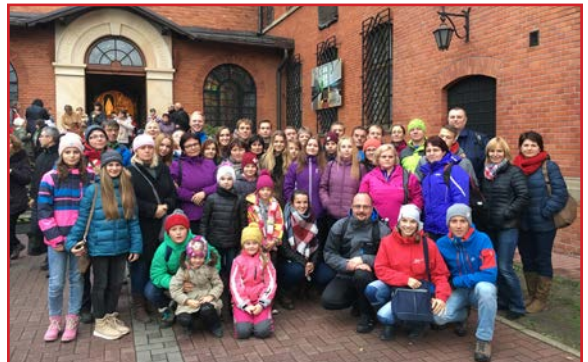
Po modlitbe Korunky