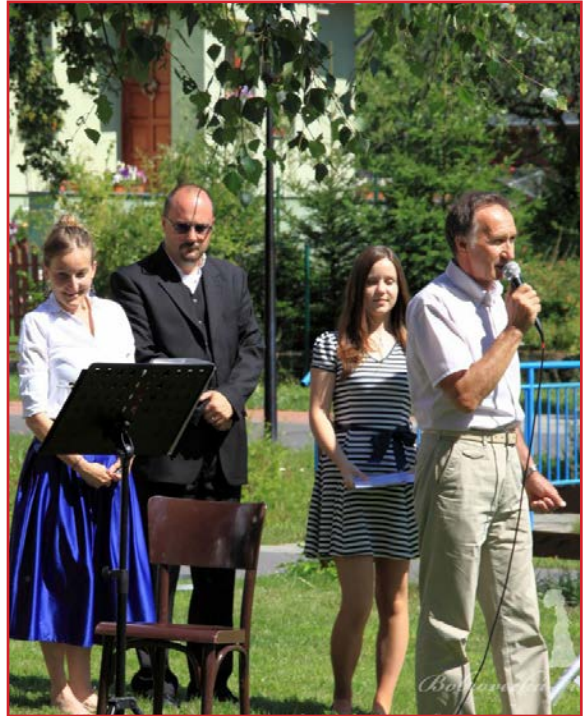
Začiatok Bobroveckej špacírky

Aj tento rok sme sa všetci spoločne stretli na sviatok Nanebovzatia Panny Márie „na dedine“. Bobroveckú špacírku slávnostne otvorilo Zdravas Mária, a potom sa rozoznala bobrovecká dychovka. Znovu sme sa hostili na vychýrených koláčikoch od šikovných gazdiniek, na chutnom kružmentovom čaji a káve. Novinkou boli knihy, ktoré si mohol ktokoľvek zobrať za dobrovoľný príspevok. Výnos z tejto zbierky bol použitý na rekonštrukciu sochy sv. Jozefa na námestí.