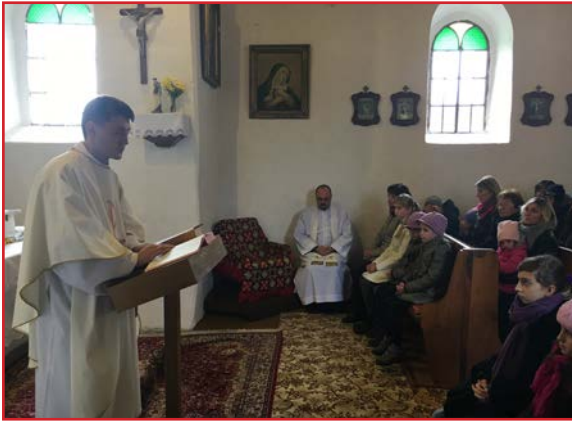
Počas slávenia svätej omše