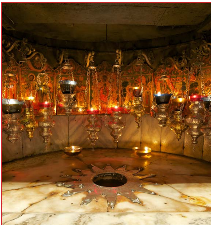
Miesto narodenia Ježiša Krista

Na Vianoce sa tešíme ako na najkrajšie sviatky v roku.