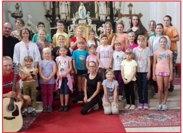
Po svätej omši