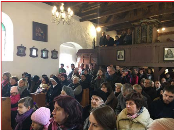
Veriaci v kostole

1. november je pre filiálny kostol v Trstenom dňom, keď sa v ňom slávi odpustová slávnosť. Je to slávnosť Všetkých svätých.