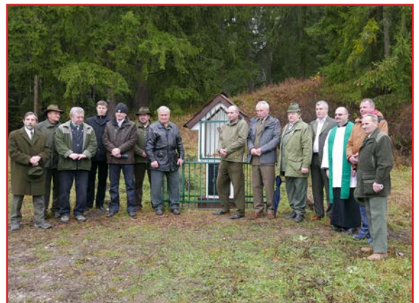
Po požehnaní kaplnky

Poľovné združenie Ráztoka darovalo farnosti Bobrovec kaplnku zasvätenú svätému Hubertovi, patrónovi poľovníkov.