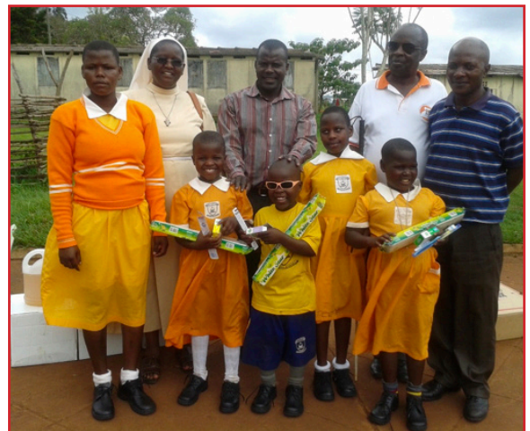
Päť nevidiacich detí, ktorým bolo zaplatené školné zo zbierky.