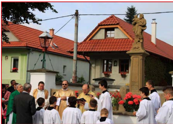
Požehnanie sochy na námestí