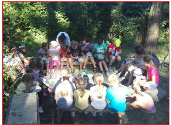
Deti počas Bodky

Koniec prázdnin sa blížil, a tak nám neostalo nič iné, len sa s nimi rozlúčiť. Bodku za prázdninami sme odštartovali spoločnou svätou omšou v piatok 26. augusta aj s našimi spevákmi. Potom sme sa vybrali na púť nielen s deťmi, ale aj s naším vlastným „indiánskym totemom“ - krížom. V boroviciach sme našli Apačov, zistili sme, ako žili a čo- to sme sa od nich naučili. Spoločne sme prešli apačskou skúškou odvahy. Lovili sme bizóny, bojovali sme so skúseným apačským bojovníkom, ale súťažili sme aj ako dva tímy. Hladné bruchá sme si zasýtli pri opekačke a tváričky detí sme premenili na tváre Apačov. Ako malú pamiatku na Bodku sme si nakoniec pomalovali vlastné indiánske masky a za odvalu pri stanovištiach sme dostali pletené náramky. Apačským tancom sme sa rozlúčili a doma sme všetkým rozprávali o super zážitkoch. Dúfame, že aj na budúcich akciách zažijeme toľko srandy.