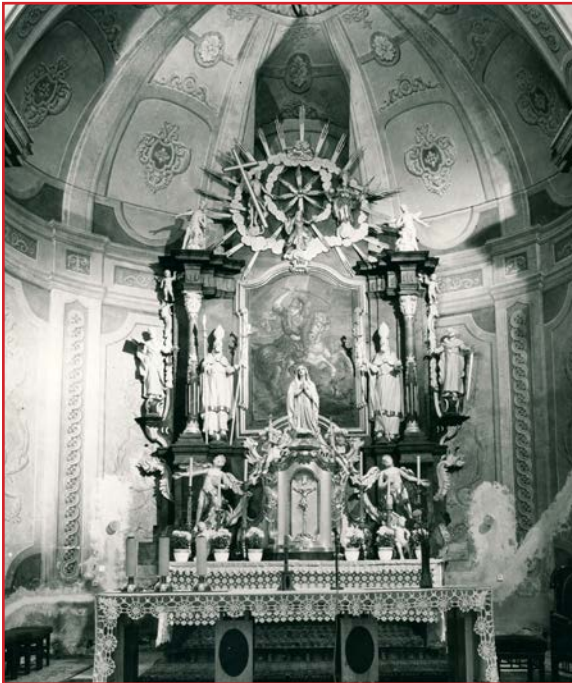
Hlavný oltár v Kostole svätého Juraja