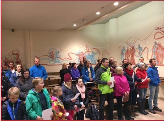
V kaplnke počas svätej omše

V končiacom roku milosrdenstva sme sa rozhodli vycestovať do Poľska, do Krakova - Lagiewnikov. Je to vzácne miesto, kde v minulom storočí vznikla úcta k Božiemu milosrdenstvu prostredníctvom zjavení sv. sestry Faustíny Kowalskej. Využili sme štátny sviatok 17. november a naši spoľahliví šoféri nás autobusom dopravili na miesto, kde stojí kláštor, v ktorom posledné roky žila a umrela sestra Faustína a vedľa ktorého sa týči nedávno postavená svätyňa Božieho milosrdenstva.