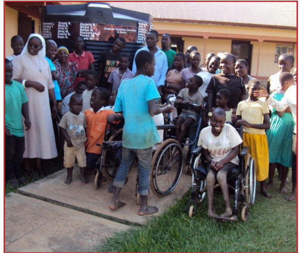
Sestra Angelina s deťmi, v pozadí vodný tank s menami darcov