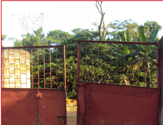
Pôvodná brána do projektu, Providence Home, Uganda